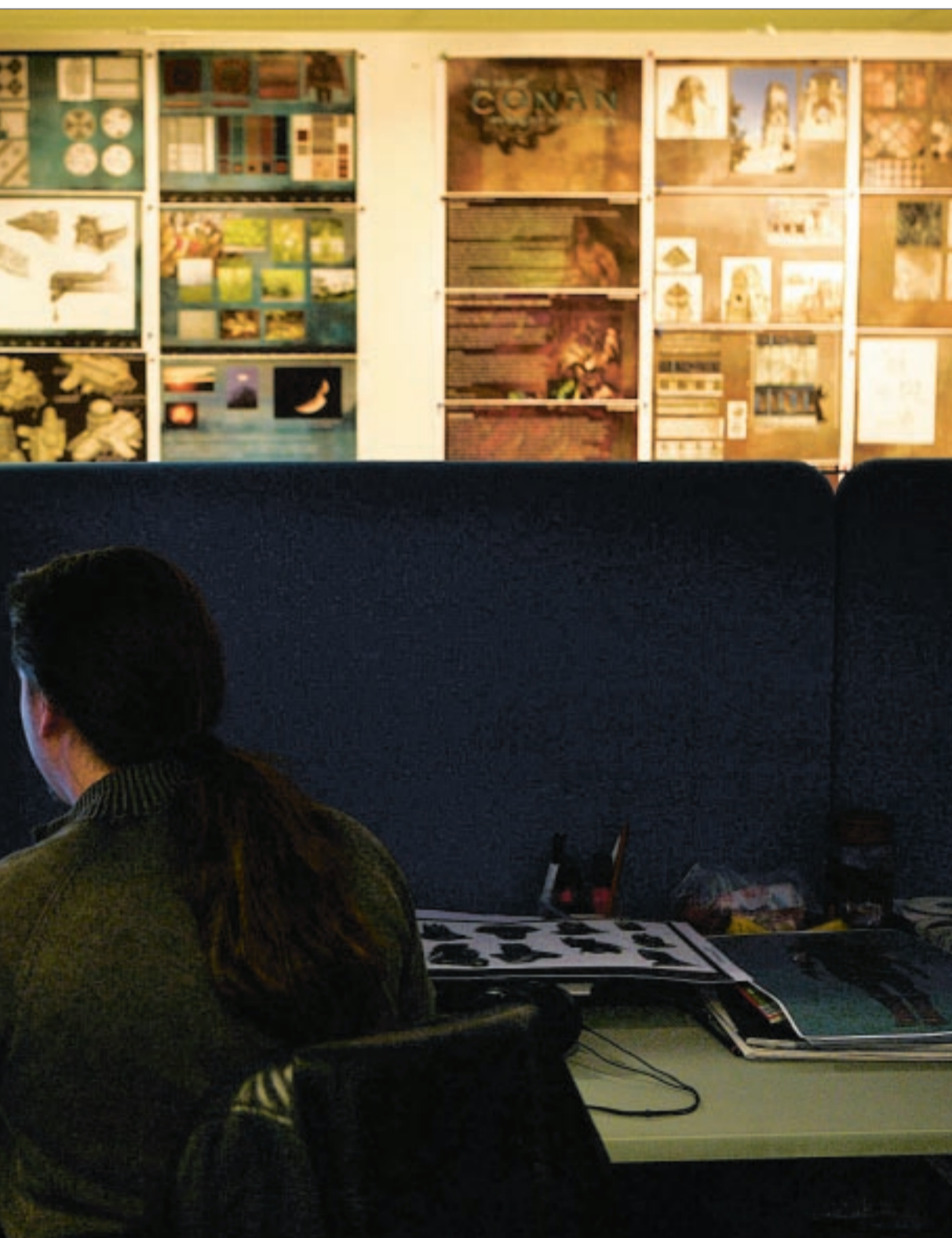
Funcoms programskapere har utviklet fra kontorlokalene i Oslo.